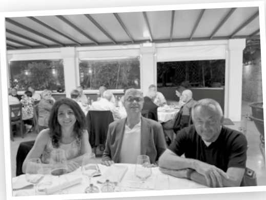
I sindaci di Sesto, Gruaro e Cordovado alla cena con Nievo